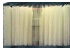
乾燥・熟成中の生そうめん