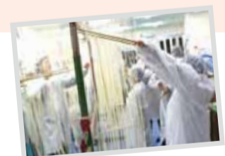
生産者訪問バスツアーにて「そうめん作り体験」